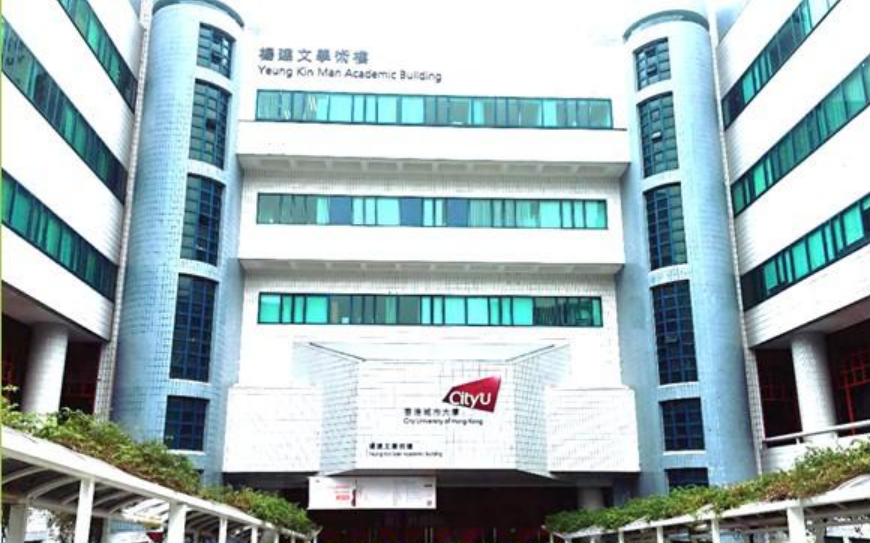
楊建文學術樓 Yeung Kin Man Academic Building