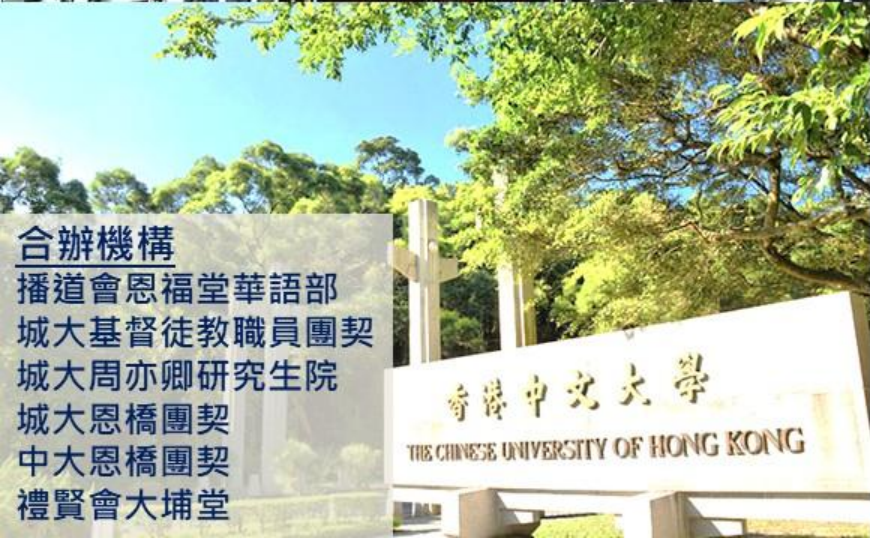
香港中文大學 THE CHINESE UNIVERSITY OF HONG KONG